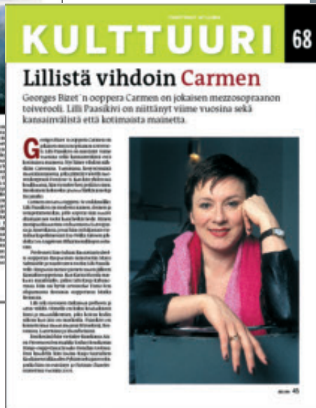
Kulttuuri-palsta poimii runsaasta tarjonnasta parhaat palat.