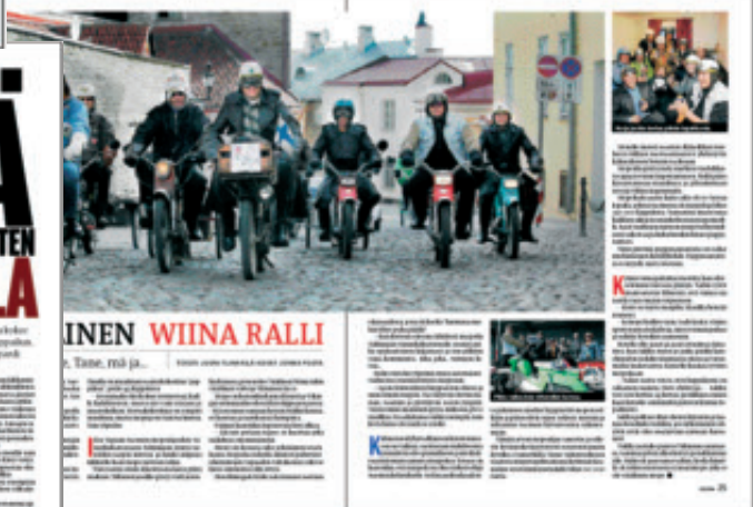
Pääosassa Seurassa on edelleen hyvä tarina.

Otsikkotyyppejä on Benton Sans, joka on piirretty uudelleen nimenomaan otsikkokäyttöä varten.