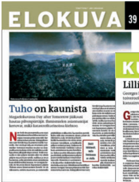
Elokuva-palsta menee kulissien taakse, kertoo ensi-iltaelokuvien taustoista ja antaa parhaat dvd-vinkit.