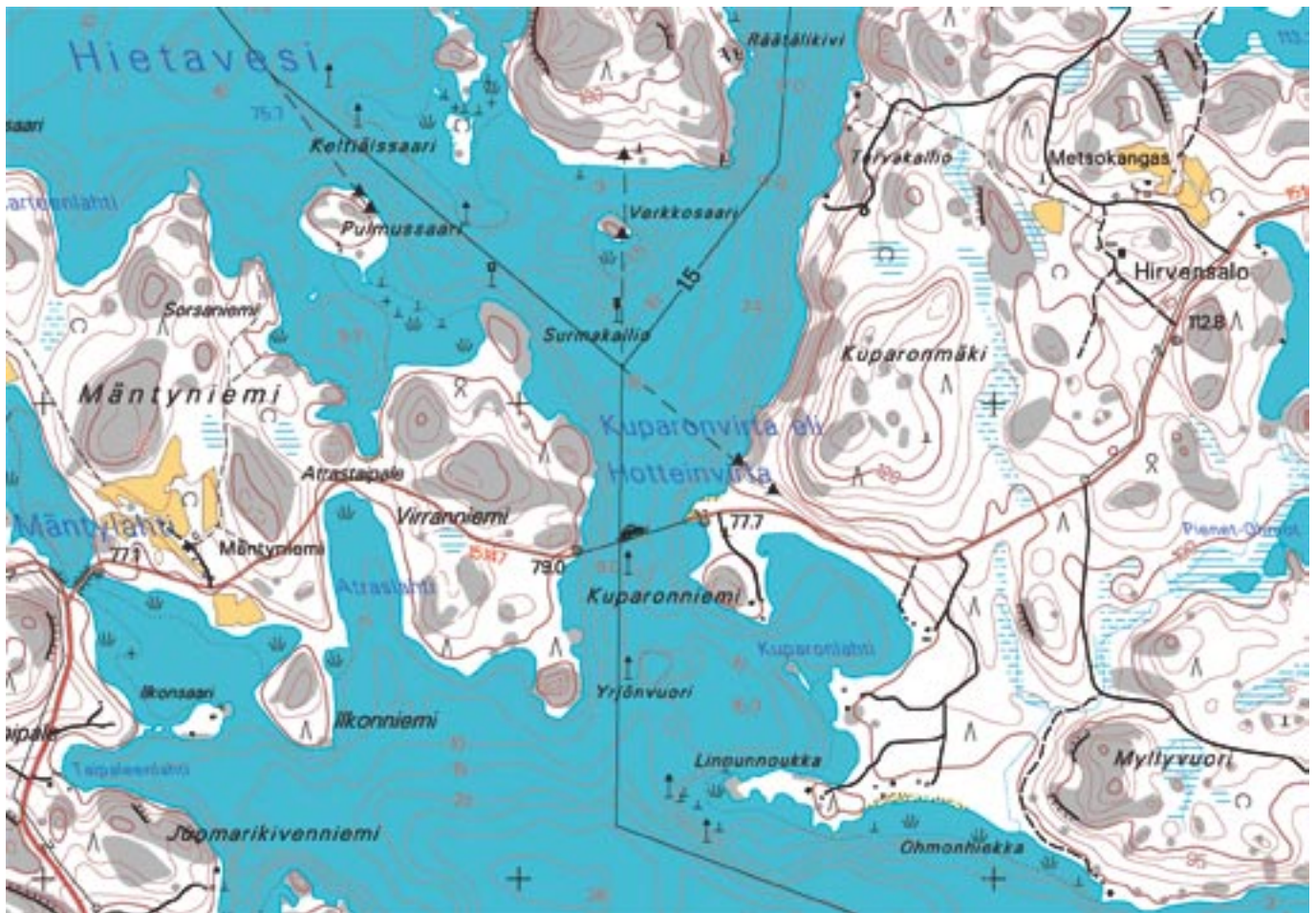
Kuparonsalmi eli Hotteinsalmi on Hirvensalon Kuparonsaaren ja mantereen Virransaaren välinen salmi Saimaan Luonterin Mikkeli–Savonlinna-laivareitin varrella.