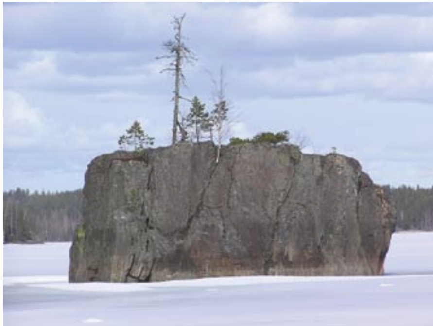
Räätälikivi Luonterissa on saanut nimen kuin leikatun muotonsa mukaan.

eri tavalla. Nimiä on annettu vähitellen, kulloisenkin tarpeen mukaan. Nimen ovat tarvinneet paikat, jotka ovat olleet yhteisön kannalta tärkeitä. Sellaisia ovat olleet monenlaiset elämiseen ja elinkeinoihin liittyvät paikat, kuten asumukset, pellot ja pyyntipaikat.