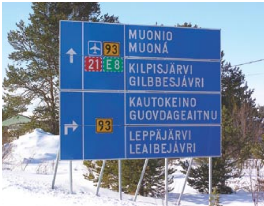
Enontekiöllä puhutaan suomea ja pohjoissaamea. Kuva on Hetasta.