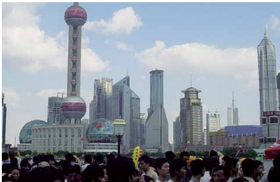
Pudongin alueen futuristisia pilvenpiirtäjiä. Välissä virtaa Huangpu-joki.