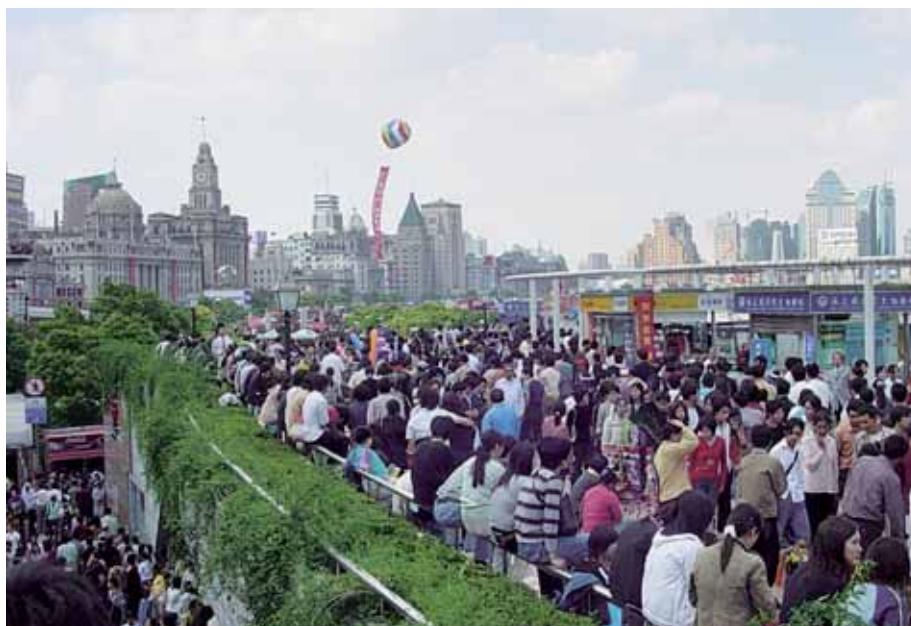
Nyt ollaan Bundilla Kiinan itsenäisyyspäivän aikaan. 16 miljoonan asukkaan Shanghaiissa riittää kulkijaa. Alla Siimatain vuori, jonne kulku on kielletty.