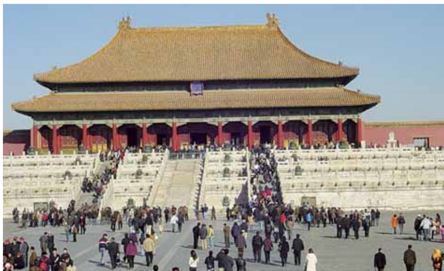
Pekingin kiellettyä kaupunkia (yllä) ja tyypillinen kävelysilta LuZhin vesikaupungissa (alla).