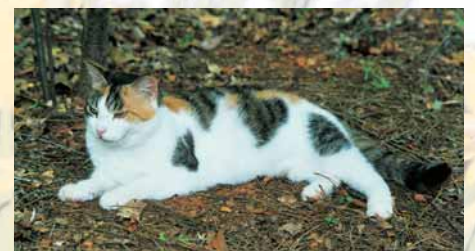
Kisu nautti Etelä-Carolinan lämmöstä.