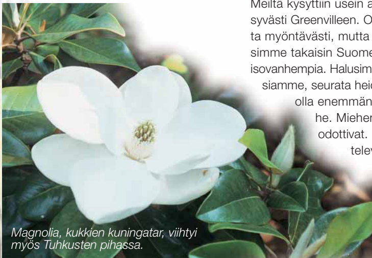
Magnolia, kukkien kuningatar, viihtyi myös Tuhkusten pihassa.

Harrastimme valokuvausta. Minulla on yli 2000 kuvaa USA:n ajalta. Kukkakuvia on valtavasti. Kasveissa oli paljon minulle tuntemattomia lajeja. Läheiset puutarhakaupat olivat kiinnostavia paikkoja. Siellä saattoi lukea kasvien nimet. Greenvilleen keskustassa on Garden Club'in kaunis, vanha rakennus ja ihana, iso puutarha. Talo on samalla myös